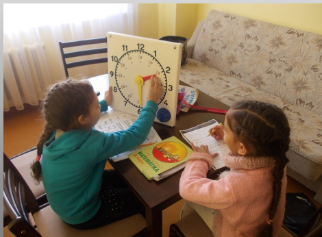
Romu bērni ārpusstundu nodarbībās

Individuāls atbalsts romu bērniem mācību stundās un ārpusstundu nodarbībās.