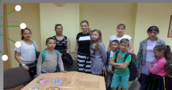
Romu mediators ar romu vecākiem un bērniem