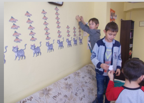
Romu bērni veido mācību materiālus

Palielinājusies vecāku interese par bērnu skolas gaitām un sekmēm.