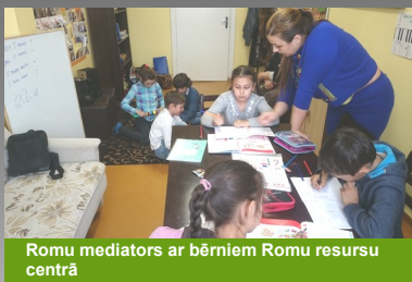
Romu mediators ar bērniem Romu resursu centrā