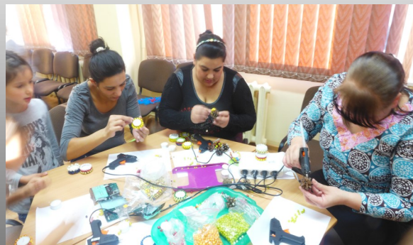
Romu vecāki kopā ar saviem bērniem darbnīcā